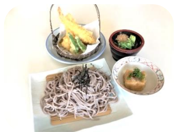
天ぷらそば・うどん 1,000円