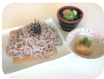
そば (温・冷) 600円