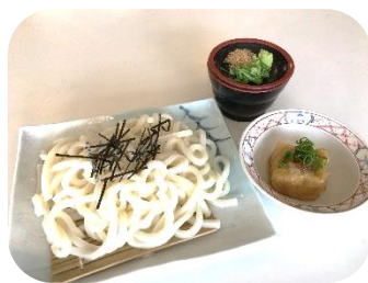
うどん (温・冷) 600円